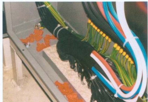
制御盤ケーブル識別 (NOR・NON)