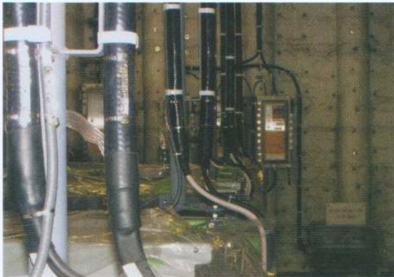
ケーブル口出し部保護 (NOR・NON)