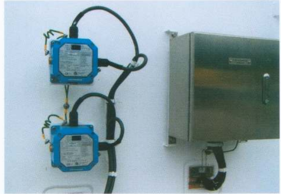
コネクターカバー (NOR・NON)