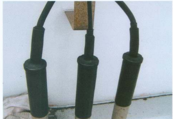
ケーブル口出し部保護 (NOR・NON)