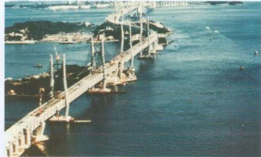
本四架橋(瀬戸大橋) (NPM)