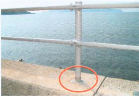
海岸沿いガードレールの地際部防食(NOR-A)