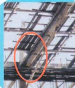
屋内側テンションメンバーに使用