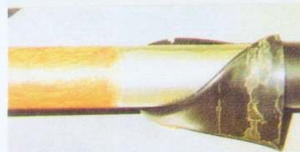
鋼管を水に浸漬後も内面接着ニシチューブを使用した部分(右側)は錆が発生していない。