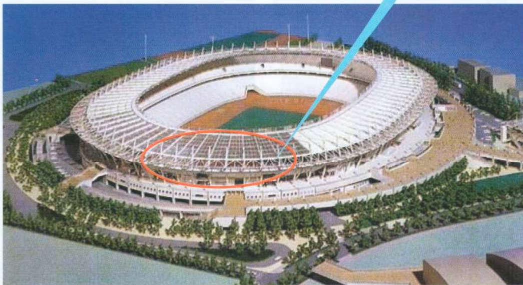
味の素スタジアムの全景