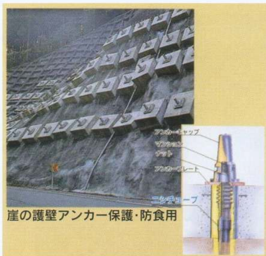
崖の護壁アンカー保護・防食用