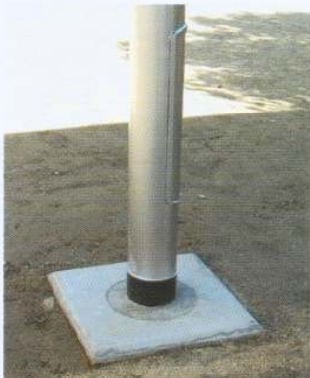
照明柱の地際防食事例