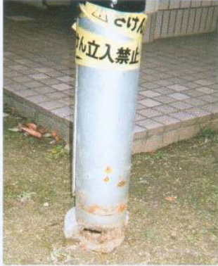
設置後7~8年で腐食した事例 (ニシチューブ未使用)