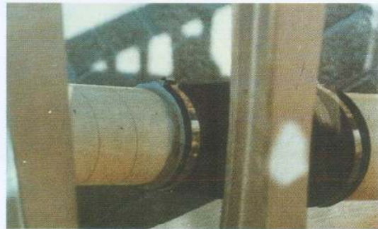
橋梁用鋼索の防食カバー (NPM)