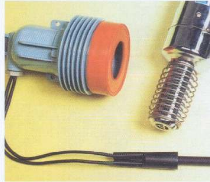
内面接着材付き2分岐熱収縮カバー (ニシブランチ)