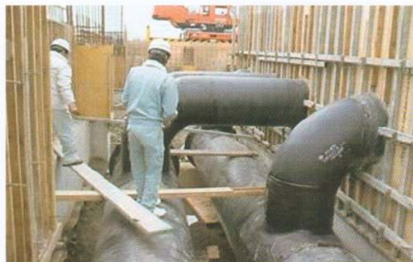
大口径鋼管防食用チューブ(NXL)