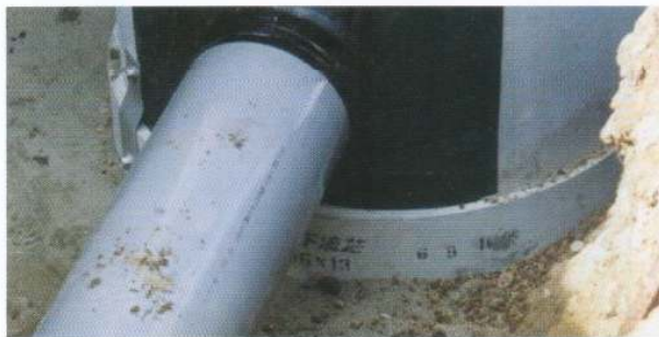
人工継手部用(NXL-HTM(可とう))