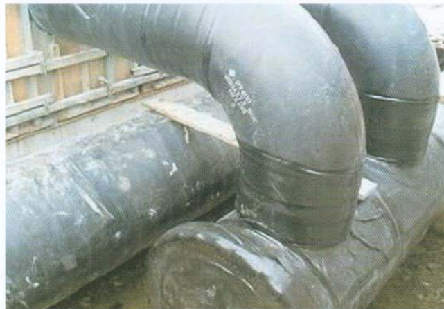
大口径鋼管防食用チューブ(NXL)