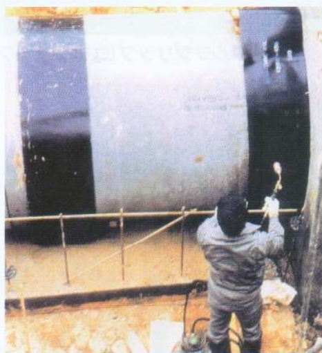
ヒューム管継手部防水 ニシチューブ(NXL-HC(C))