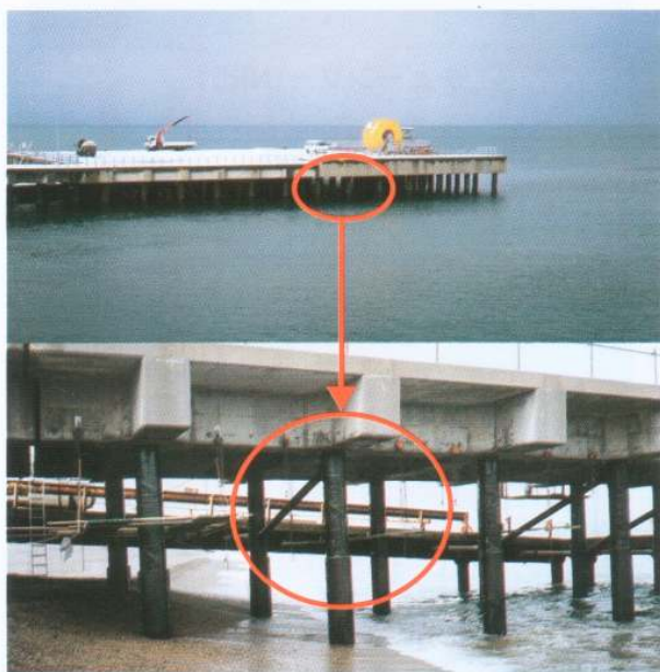
シーバース 支柱の防食(NXL-AZ)